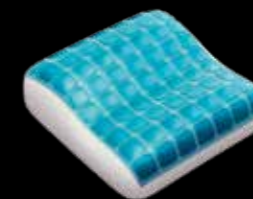
Reisekissen 31x31 cm, Höhe: 10 cm

Wir empfehlen unser Reisekissen allen Kunden, die auch auf Reisen nicht auf ihren gewohnten Komfort verzichten wollen. Das Technogel Reisekissen ist der ideale Begleiter für unterwegs.