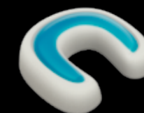
Nackenhörnchen 31x27 cm, Höhe: 8,5 cm

Wir empfehlen unser Reisekissen allen Kunden, die auch auf Reisen nicht auf ihren gewohnten Komfort verzichten wollen. Das Technogel Reisekissen ist der ideale Begleiter für unterwegs.